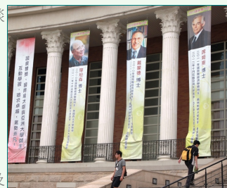
圖說：諾貝爾學者席姆斯博士將蒞校講學，亞洲大學、策略聯盟國立大里高中等師生期待跟大師學習。

10月10月26日下午2時至5時10分，本校辦理諾貝爾大師論壇-「遠離風暴•穩健前行」經濟高峰會，資訊發展處為服務無法入場的師長、同仁及同學，特提供網路現場直播之服務，如欲進入諾貝爾大師論壇直播，可於本校首頁橫幅，點選第一個連結「現場直播」，即可進行收看。本校網址： http://web.asia.edu.tw