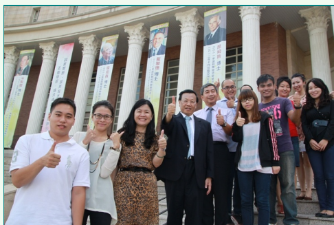
圖說：亞洲大學校門口懸掛諾貝爾經濟大師席姆斯博士布條，校長蔡進發(左四)、管理學院院長蔡明田(左五)與師生歡迎席姆斯博士蒞校演講。